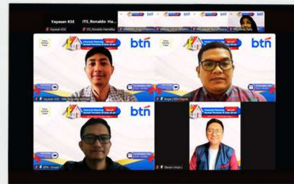
FINANCIAL PLANNING: MERAH RUMAH PERTAMA DI USIA 20-AN BERSAMA BANK BTN