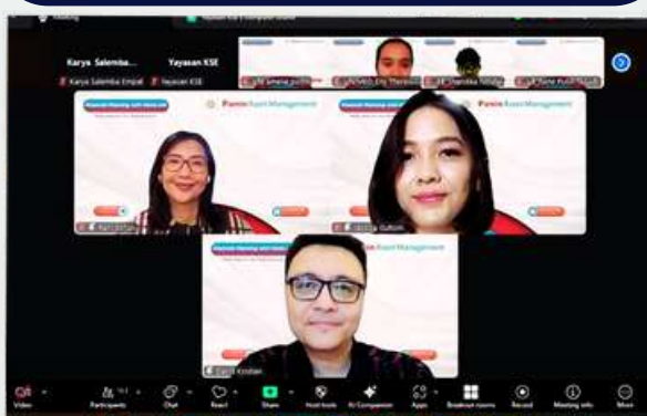
FINANCIAL PLANNING WITH PANIN-AM: SMART STEPS FOR YOUR FINANCIAL FUTURE