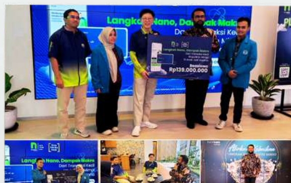
TATAP MUKA PENERIMA BEASISWA KSE DAN CIMORY SCHOLARSHIP PROGRAM.

Acara ini diikuti oleh 134 mahasiswa penerima beasiswa dari UGM, UNDIP, dan UNS, dibuka dengan sambutan perwakilan Yayasan Karya Salemba Empat, PT Cimory, dan UGM yang menekankan pentingnya kolaborasi dunia pendidikan dan industri dalam mempersiapkan mahasiswa memasuki dunia profesional. Kegiatan dilanjutkan pemaparan company profile Cimory dan talkshow mengenai dunia manufaktur pangan yang membahas struktur organisasi, proses produksi, serta peluang karier, kemudian ditutup dengan sesi Career Talk dan FGD bersama tim Cimory membantu peserta memahami kompetensi kerja, perencanaan karier, dan kesiapan menghadapi tantangan profesional.