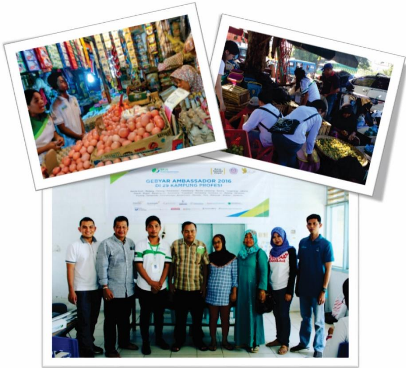
Foto Bersama Kepala BPJS TK Cabang Manado, Pegawai BPJS TK, dan Perwakilan Panitia

Sosialisasi Panitia Grebek Pasar dan Paguyuban KSE Unsrat Beserta Alumni dengan cara turun langsung ke pasar dan jalan untuk pembagian Brosur dan Informasi kepada pedagang seputar manfaat menjadi Anggota BPJS Ketenagakerjaan