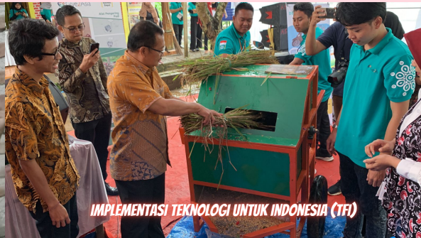
IMPLEMENTASI TEKNOLOGI UNTUK INDONESIA (TFI)