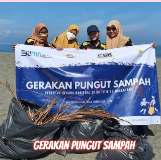
GERAKAN PUNGUT SAMPAH